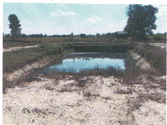
บ่อน้ำเสียไม่ถูกต้องตามหลักวิชาการ