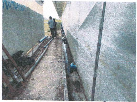
เศษมูลสุกรตกค้างในรางระบายน้ำ