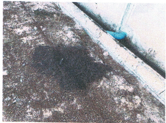
เศษมูลสุกรเทกองข้างอาคาร